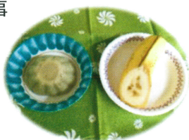
バナナのソフト食