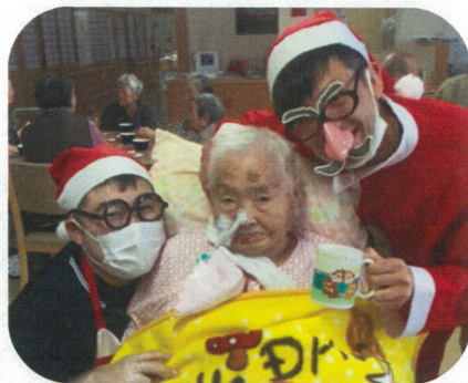
湖水の里でクリスマス会をしました。みんなで盛り上がりました！