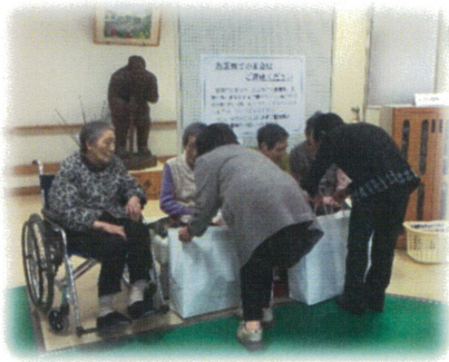
日赤奉仕団様よりタオルを寄贈していただきました