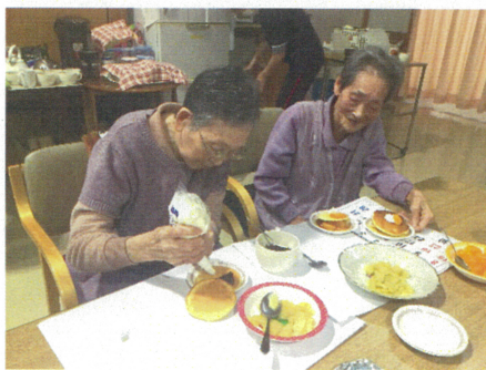
集中して作業しています

土笛の里で、おやつにホットケーキを作りました。焼き上がったケーキに果物やあんこを飾り付けて、皆さんで美味しくいただきました。