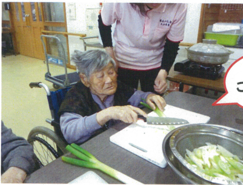
大きさを これでいい