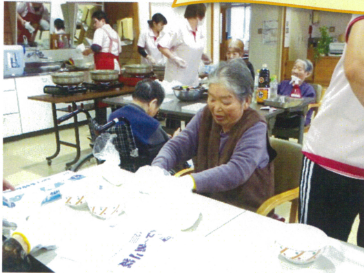
力が入るだまご作り

三月十三日に昼食のだまご鍋作りをしました。皆さんで野菜を切ったりだまごを丸めたり楽しく作業しました。 お昼には昨日作ったリンゴのコンポートも出され、「皆で作ったから美味しい」とお腹いっぱい召し上がっていました。